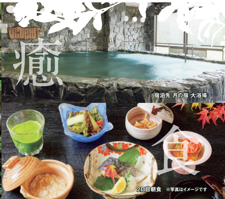
宿泊先 月の宿 大浴場