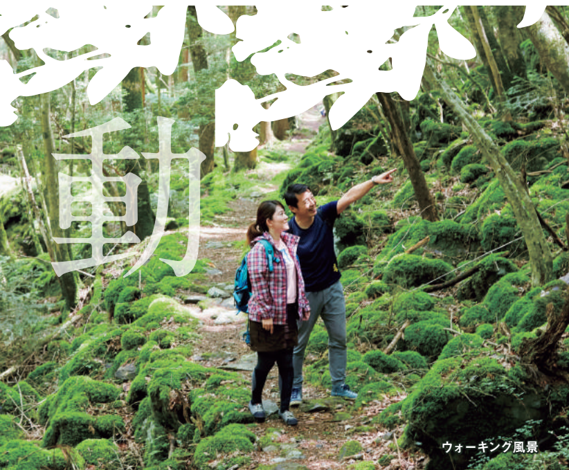
ウォーキング風景